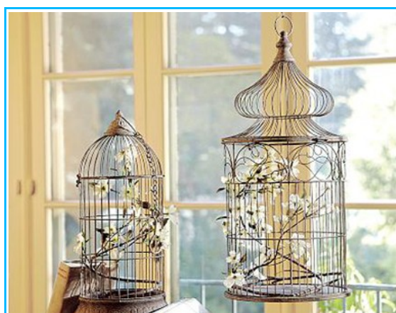
Imagem4- Elemento decorativo