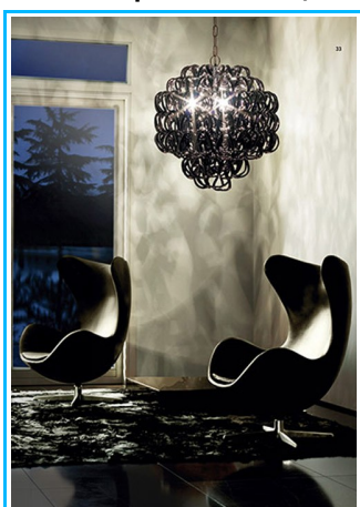
Imagem3- Elemento decorativo de iluminação

Pode ser aplicada em salas comerciais, residências, espaços em locais públicos, etc.