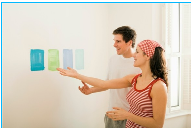
Imagem5- Processo de decoração