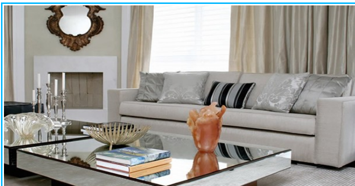
Imagem2- Sala de estar decorada com adornos